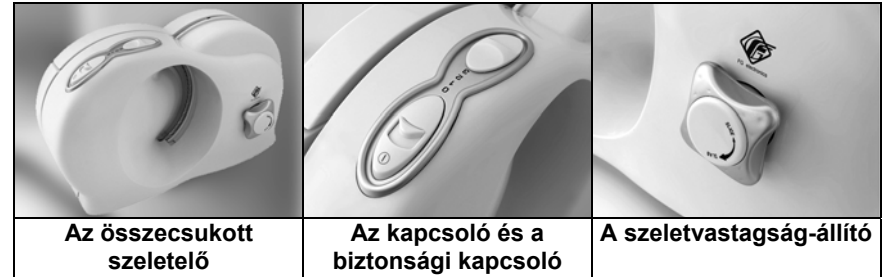
Az összecukott szeletelő